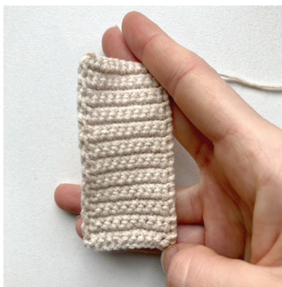
Základný pásik na hrkálky

Ak má hrkálka iný základ hlavy, ako tento, pri každom návode je písaný osobitne.